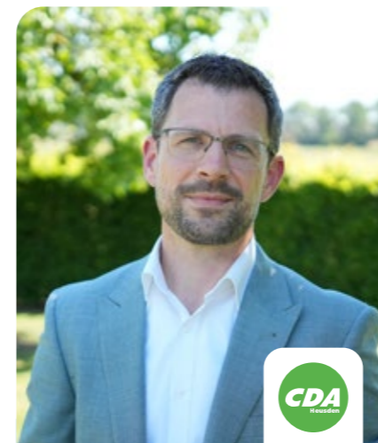
Ton Pulles Mobiliteit, werk en recreatie & toerisme